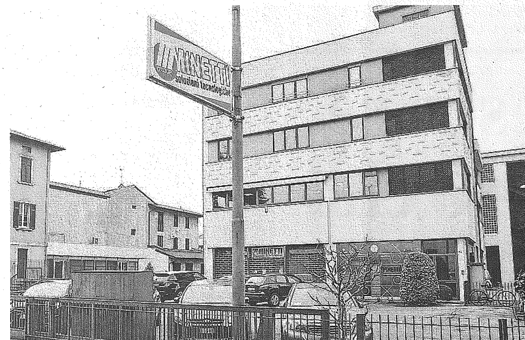
La sede e punto vendita della Minetti Spa in via Canovine a Bergamo

Fondata nel 1951, la Minetti, con sede a Bergamo in via Canovine, è leader in Italia nella distribuzione di forniture industriali: nel 2018 ha fatto registrare un fatturato aggregato di circa 200 milioni di euro e dispone di una rete di 26 filiali commerciali e conta 500 dipendenti in Italia (un centinaio nella nostra provincia). Eccellenza italiana all'interno di un grande gruppo europeo, la Minetti lavora su tutto il territorio nazionale e ha fra i suoi clienti, tanto multinazionali quanto piccole imprese. Ampia la gamma di prodotti con 15 mila brand e oltre 500 mila referenze relativi a svariate categorie, dai cuscinetti alla